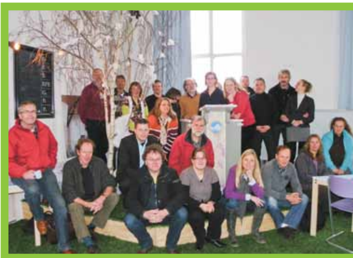
Bedrijfsplanbijeenkomst medewerkers in een kerkje in Boksum

De wereld is de afgelopen tijd op het gebied van vergunningverlening en handhaving erg veranderd. Ook ontwikkelingen rondom de komst van regionale uitvoeringsdiensten, de kwaliteitscriteria, de bezuinigingen en gemeentelijke herindelingen maakten het voor de Milieudienst noodzakelijk om de strategie voor de komende jaren opnieuw te bepalen. In het eerste halfjaar van 2010 is op basis van input van de medewerkers en de bestuurders van de dienst een nieuw bedrijfsplan opgesteld. In juni is het bedrijfsplan voor de periode 2011 – 2015 door het Algemeen Bestuur goedgekeurd. In de tweede helft van 2010 zijn de doelstellingen geconcretiseerd en vastgelegd in activiteitenplannen.