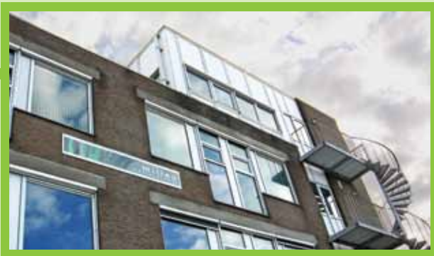
Milieuadviesdienst Regio Noord-Friesland

De Milieuadviesdienst is een professioneel dienstverlenend samenwerkingsverband van 15 Friese gemeenten dat gemeentelijke en (semi-) overheden adviseert en motiveert om in samenwerking de kwaliteit van de leefomgeving te behouden en verbeteren.