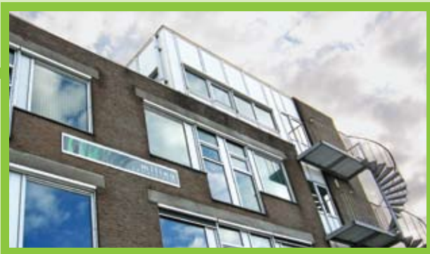
Milieuadviesdienst Regio Noord-Friesland

De Milieuadviesdienst is een professioneel dienstverlenend samenwerkingsverband van 15 Friese gemeenten dat gemeentelijke en (semi-) overheden adviseert en motiveert om in samenwerking de kwaliteit van de leefomgeving te behouden en verbeteren.